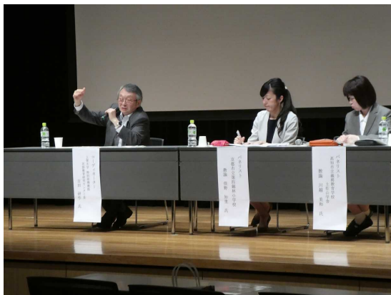
フロアとの質疑応答の様子